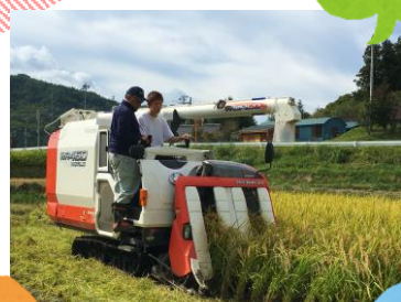
循環型農業 の技術