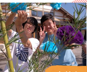
高齢者の 健康づくり