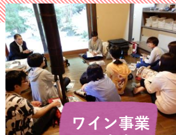
ワイン事業 の未来