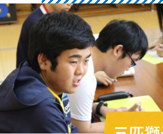
三匹獅子舞 の継承